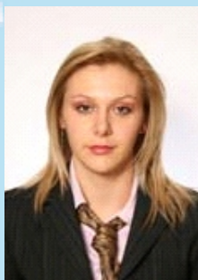
Rita Hajzeraj (AKR) Zëvendëskryetare e Parë