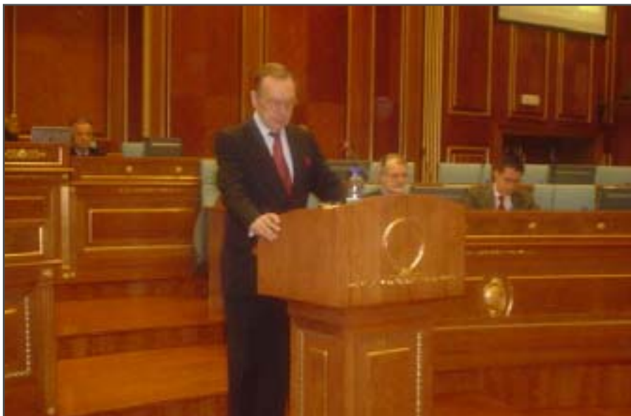
Hollkeri iu drejtohet deputetëve të Kuvendit të Kosovës

E di që kjo dhunë nuk ka qenë vepër e tërë shoqërisë. Ka qenë vepër e një grupi të vogël të njerëzve që e kanë planin e tyre për Kosovën. Plani i tyre është një Kosovë në të cilën ata qeverisin përmes dhunës dhe kërcënimit, duke e mbajtur tërë popullin e Kosovës peng për qëllimet e tyre. Plani i tyre nuk e pranon demokracinë, e refuzon sundimin e ligjit, plani i tyre e mohon trashëgiminë e pasur kulturore të Kosovës dhe shumëllojshmërinë etnike, plani i tyre nuk ofron zhvillim ekonomik, ai premtion që Kosova do të jetë e varfër në Evropë, theksoi Hollkeri