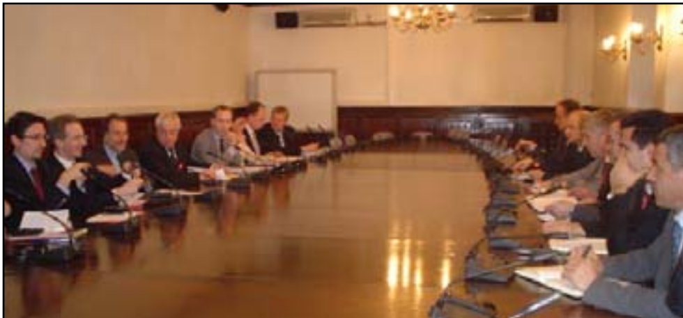
Takimi i Kryesisë së Kuvendit të Kosovës me përfaqësuesit e UE-së, Solana e Paten

Vendosmëri për t'i dënua krimin dhe kriminelët. -Përfaqësuesit serbë të Kryesisë shprehen se institucionet e Kosovës nuk janë të gatshme të marrin përgjegjësitë për revoltat e dhunshme, kurse përvjetorin e ndërhyrjes së NATO-s në Kosovë e vlerësojnë vit jubilar i spastrimit etnik të serbëve SOLANA: Nga takimi po dal më pesimist se kur kam hyrë