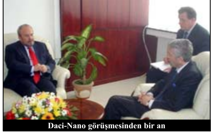
Daci-Nano görüşmesinden bir an

Arnavutluk Başbakanı Fatos Nano, iki ülke enstitüsyonlarının daha yoğun işbirliğine gereksiniminin körüklenmesi ve beyan edilmesinden başka, ortak müttefikler konusunda