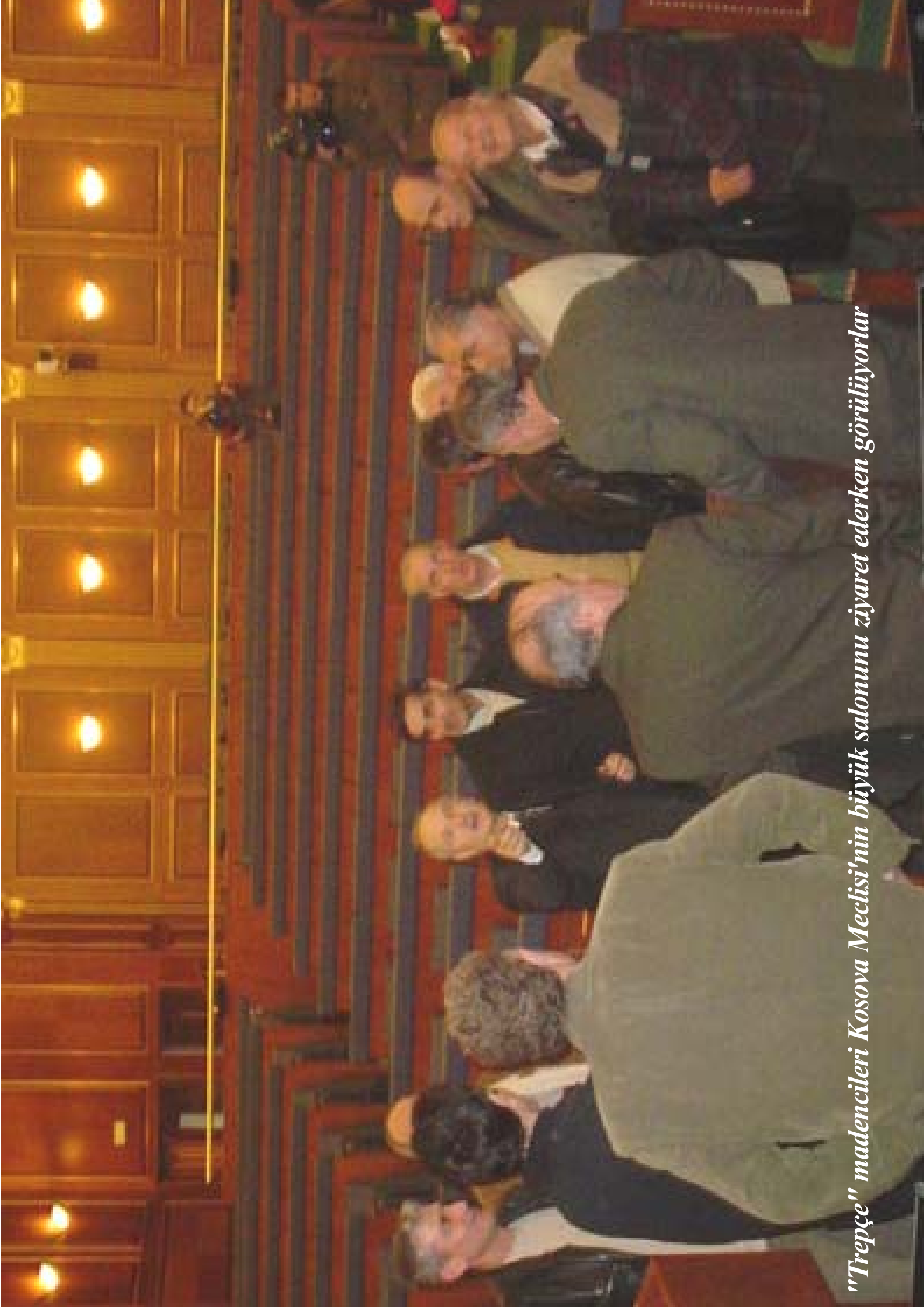
"Trepçe" madencileri Kosova Meclisi'nin büyük salonunu ziyaret ederken görüliyorlar