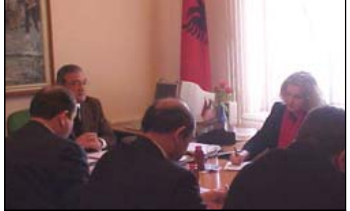
Arnavutluk Meclisi Endüstri ile Taşımacılık Komisyonu üyeleriyle yapılan toplantısından bir görüntü

İş gecelerinden birinde Arnavutluk Meclisi Başkanı Servet Pëllumbi ile bulunulan görüşme süresinde, sıcak hava içinde, özellikle öncüllüğü olan konular başta olmak üzere her iki ülkenin hayati ulusal konularına değinildi. Sayın Pëllumbi, bu münasebetle, Kosova konusu ve onun en doğru bir şekilde çözümlenmesi, Arnavut enstitüsyonların gündem sırasında önemli yeri olduğunu ileri sürdü ve bu yönde devamlı olarak etkin olduklarını vurguladı. Edita Tahiri, kendi tarafından, Kosova'daki politik süreçlere ve dolayısıyla standartların uygulanması ve ülkenin heryanlı kalkınması