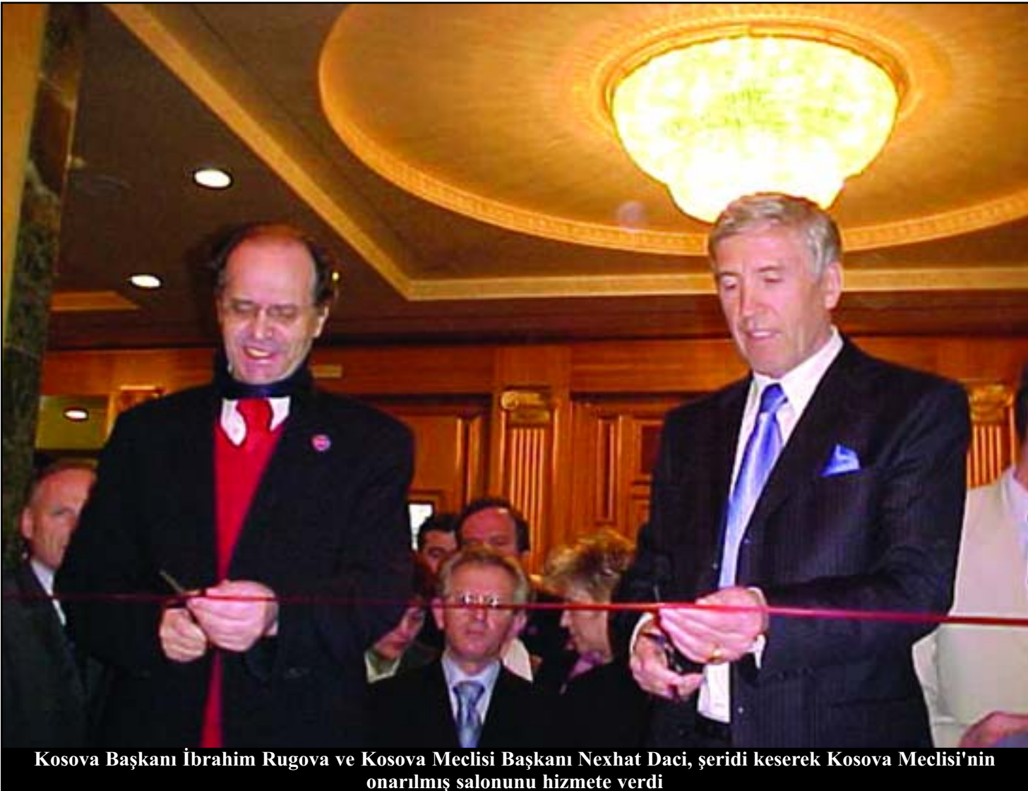
Kosova Başkanı İbrahim Rugova ve Kosova Meclisi Başkanı Nexhat Daci, şeridi keserek Kosova Meclisi'nin onarılmış salonunu hizmete verdi

Bu yılın 16 şubat tarihinde Kosova Meclisi'nin onarılmış salonu hizmete verildi. 8 ay süren çalışmalar sırasında Kosova Meclisi'nde salon, hol ve giriş kapıları onarılmıştır. Geçen yılın Temmuz ayında başlayan Meclis'teki onarım işleri, "Mabetex Group" şirketi'nin işçileri tarafından gerçekleştirilmiştir. Kosova Meclisi Binası'nın onarılması sırasında, diğerleri arasında, oyların elektronik sayılmasını sağlayacak elektronik aygıtlar, seslendirme, havalandırma, ısıtma sistemi ve diğerleri kapsamıştır. Demek oluyor ki, Kosova Meclisi'ndeki tüm organların çalışması için optimal koşullar sağlanmıştır. Meclis salonunda yapılan değişiklikler sayesinde, Kosova Meclisi'nin milletvekilleri ile tüm çalışanları, çalışmanın bütün kesimlerinde daha iyi çalışma koşullarına sahip olmuştur. Teknik alandan bakılırsa, bunların hepsi milletvekillerine, Avrupa ile Dünya Meclisleri'nin standartlarına göre çalışmaları sağlayacaktır. Kosova Meclisi salonunun törenli açılışını Kosova Başkanı Ibrahim Rugova ve Kosova Meclisi Başkanı Nexhat Daci yaptı. Kosova Başkanı Ibrahim Rugova'yla birlikte şeridi kesen Kosova Meclisi Başkanı Nexhat Daci, Meclis salonunun yeni haliyle hizmete verilmesinin, Kosova enstitülerine, gerçekten Avrupa'ya ve demokrasi dünyaya benzeyen çalışma alanını sağladığı kanıtını teşkil ettiğini belirtti.