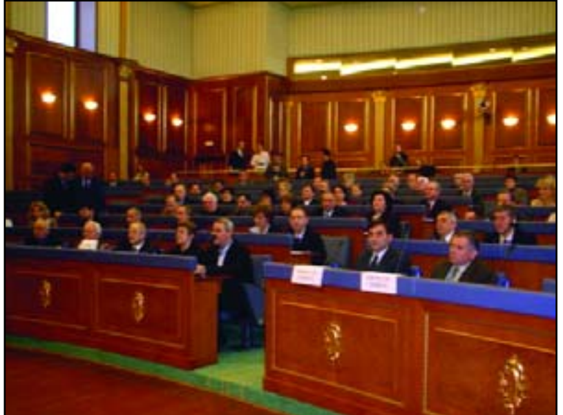
Kosova Meclisi'nin onarılmış salonunda düzenlenen toplantıdan bir görüntü

Meclis salonunun törenli açılışı sırasında konuşmada bulunan Kosova Başkanı Ibrahim Rugova, özetle şunları dedi: "Bu, Kosova'daki ilerlemenin bir işaretini daha göstermektedir. Meclis salonunun törenli bir şekilde hizmete verilmesi, Kosova enstitülerinin çalışma için elverişli devlet objelerini sağlamaya kararlı olduğunu gösteren, önemli olaylardan birini teşkil etmekte birlikte, ülkemiz ile bağımsızlığın sembolü olacaktır". Bu münasebetle Başkan Rugova, daha iyi çalışma koşullarının sağlanması amacıyla, Meclis binasının komple olarak onarılması ve aynı zamanda Hükümet ile Bakanlıklar binasının inşa edilmesi yönündeki diğer adımların atılması olanaklarının incelenmesini de önerdi. Kosova Meclisi holunda bazı resimlerin duvarlara asılması yüzünden, UNMIK şefi Harri Holker, Kosova Meclisi salonunun törenli açılışına katılmadı. Genel Administratör Holkeri'nin düşüncesine göre, holde asılı olan resimler monoetnik özelliğini taşımaktadır. Onarım işlerinin tamamlanmasından sonra, Kosova Meclisi ilk oturumunun 18 şubat 2004 tarihinde düzenlenmesi öngörülmüştü, fakat milletvekillerinin oturacakları yerleriyle ilgili anlaşmazlığın belirmesi yüzünden, o gün toplantı yapılamadı. Öyleki, Meclis toplantısı ancak ertesi gün, yani 19 şubat 2004 tarihinde düzenlendi.