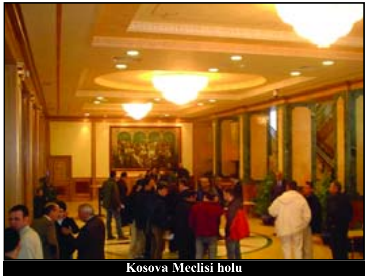
Kosova Meclisi holu