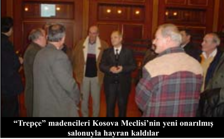
"Trepçe" madencileri Kosova Meclisi'nin yeni onarılmış salonuyla hayran kaldılar

"Trepçe" madencilerinin grevini, büyük değer taşıyan bir olay olarak değerlendiren Prof. Dr. Fatmir Sejdiu, yeniden canlandırılması amacıyla "Trepçe" sorununun çözülmesi konusunda tüm Kosova politik öznelerinin oydaş olduklarını ileri sürdü