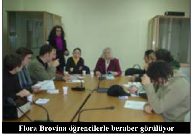
Flora Brovina öğrencilerle beraber görülüyor

Sözkonusu üniversite öğrencileri gurubuyla görüşen milletvekili Flora Brovina, onlara Kosova Kurtuluş Savaşı ve bir halkı soykırımdan kurtarma çabasında bulunan uluslararası topluluğun girişimi hakkında bilgi vermeye çalıştı. Bu savaşı Kosova insanların hayatlarıyla, dünya ise parayla ödemiş oldu. Ne yazık ki savaş yaraları hala açıktır. Çünkü Belgrad'ın Bataynisa toplu mezarlığında hala kayıp Kosovalıların 800 cenazesi bulunmaktadır ve cenazelerin Kosova'ya geri çevrilmesi, dünyanın Belgrad'a yapacağı baskısına ve Sırbistan'ın isteğine bağlıdır. Bunların yanı sıra daha 3.200 kişinin kayıp olduğu düşünülmektedir. Aynı zamanda bizler, savaştaki rolüne önem vermesizin Sırp mensupları sıralarından