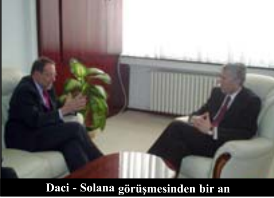
Daci - Solana görüşmesinden bir an

SOLANA: Standartların operasjonalizasyonu ile ilgili belgeleri, Kosova Meclisi'nde onaylanacak olan esas yasalarla güçlendirmek gerek