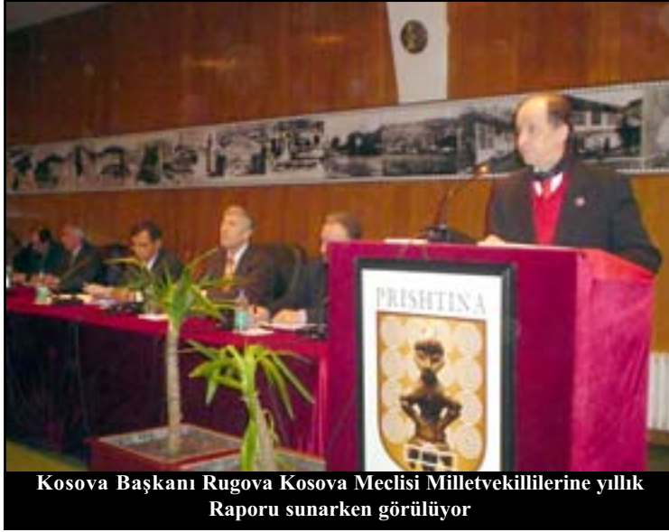
Kosova Başkanı Rugova Kosova Meclisi Milletvekillerine yıllık Raporu sunarken görülüyor

Bu münasebetle ben, 10'dan çok esas sistemli ve diğer yasaları, aynı zamanda ülkemiz yurttaşlarının çıkarından olan çeşitli rezolüsyon ile beyannameleri onaylayan Kosova Meclisi'nin çalışmalarına değinmek istiyorum. Düşünceme göre, bu dönem içerisinde Kosova, enstitülerin demokrasi çalışması