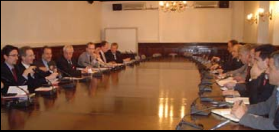
Kosova Meclisi Başkanlık Kurulu'nun, Avrupa Birliği temsilcileri Solana ve Paten ile yapmış olduğu görüşmeden bir an

Cinayetler ve cinayet işleyenlerin cezalandırılması kararlılığı.- Başkanlık Kurulu'ndaki Sırp temsilcileri, Kosova enstitülerinin, saldırılarıyla ilgili sorumluluğu üstlenmeye hazır olmadıklarını belirterek, Kosova'daki NATO müdahalesinin yıldönümünü Sırpların etnik temizlenmesi yılı olarak değerlendirdiler.-Solana: Bu görüşme- den sonra kendimi oldukça kötümser hissetmekteyim