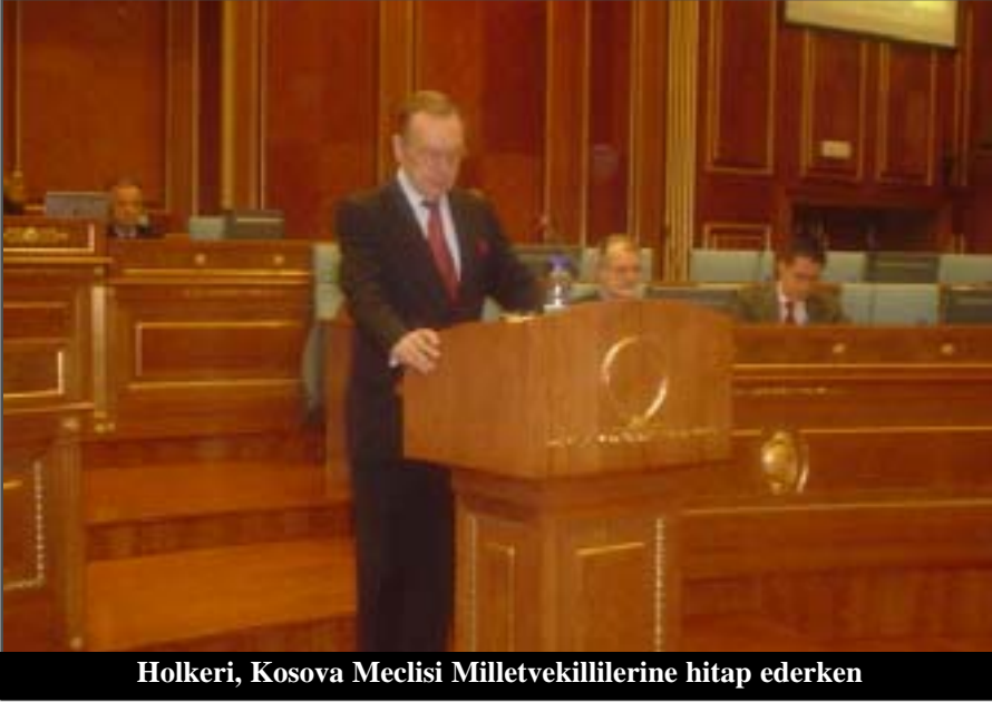
Holkeri, Kosova Meclisi Milletvekillilerine hitap ederken

Bu şiddetin, bütün toplumun eseri olmadığını biliyorum. Bu, Kosova ile ilgili kendilerine öz planları olan küçük bir grup insanın eseri olduğunu biliyorum. Onlar, çıkarları için bütün Kosova halkını esir tutarak, şiddet ve tehditlerle yönetecekleri bir Kosova'nın kurulmasını planlaştıranlardır. Onların bu planı demokrasiyi kabul etmez, yasaların geçerliliğine karşı gelir, Kosova'nın zengin kültürel mirasını ve çok renkli etnik varlığını yadsır, onların bu planı ekonomik kalkınmaya hizmet edemez, bu Kosova'nın Avrupa'da fakir olmasına yola açar, diye vurguladı Holkeri.