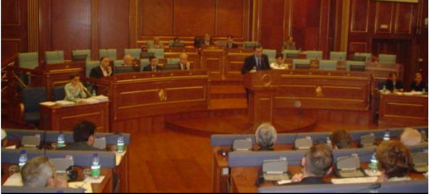
Kosova Meclisi toplantısından bir an