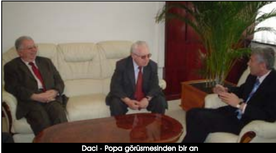
Daci - Popa görüşmesinden bir an

Kosova Meclisi Başkanı Nexhat Daci bugün, Arnavutluk Bilim Akademisi Başkanı Ylli Popa ve beraberindeki Kosova Bilim ile Sanat Akademisi Başkanı Rexhep İsmajli kabul etti. Kabul sırasında, akademiler arasındaki işbirliği, onların toplumsal ile maddi durumu ve toplumun bütünlüklü gelişmesindeki fonksiyonu konuları ele alındı. Bu görüşmenin devamında Profesör Daci, belirli maddi ile manevi desteği olmayan Kosova Bilim ile Sanat Akademisi'nin maddi durumundan memnun olmadığını belirterek, bir bütünlük olarak bilimin ve Kosova'daki bilimsel enstitülerinin dinamik gelişmesi esası