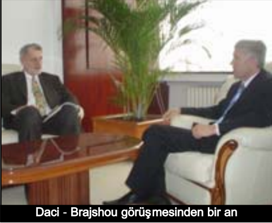
Daci - Brajshou görüşmesinden bir an

Standartlar yerine getirilecek ve bu doęrultuda Kosova'nın en yüksek yasama organını da katkısını sunacaktır