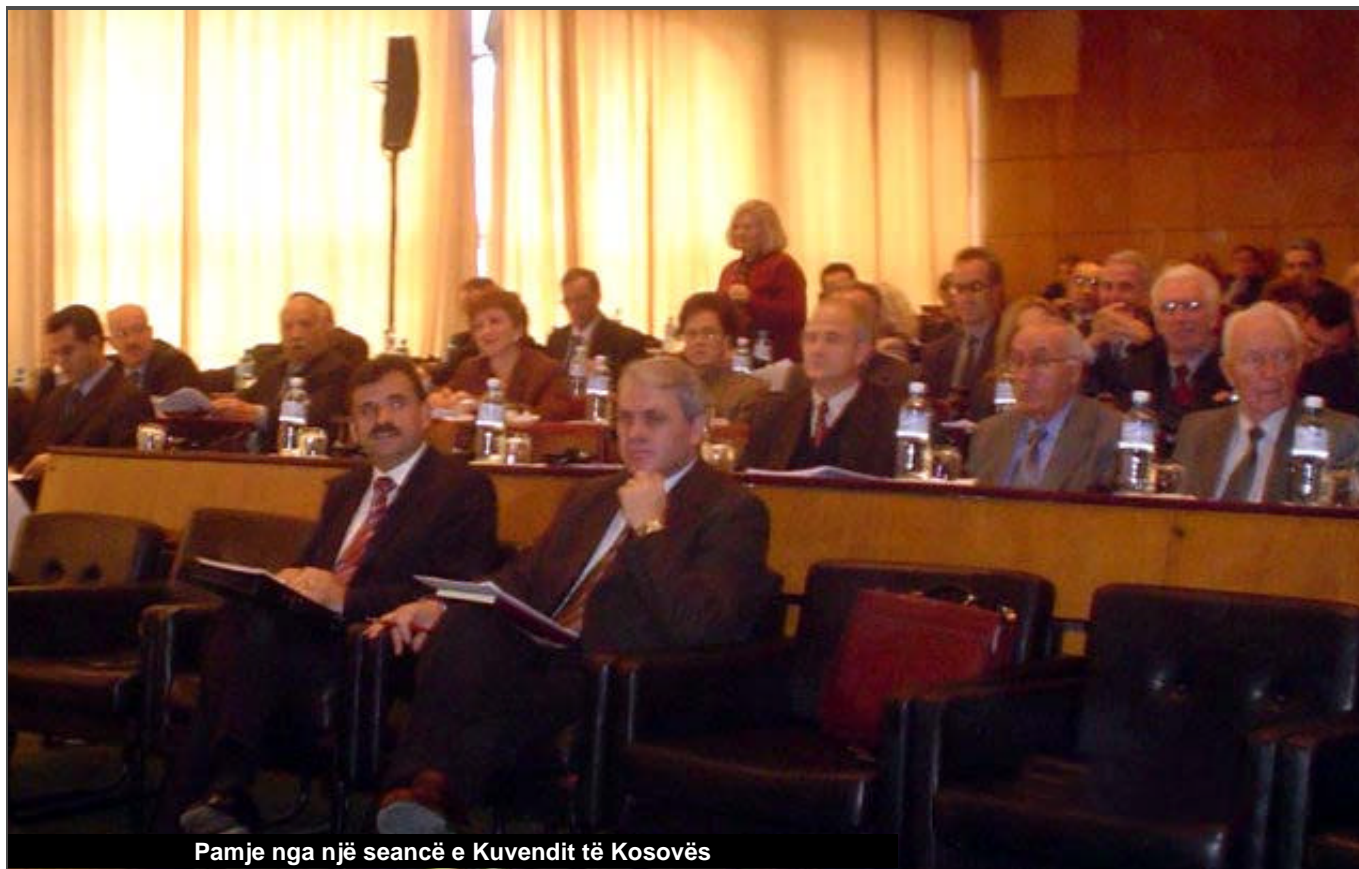
Pamje nga një seancë e Kuvendit të Kosovës

Parlamentar të Lidhjes Demokratike të Kosovës theksoi se përkrahim iniciativën dhe mendojmë që, kjo ditë është kur duhet të mirret iniciativa, ose nisma për procedurën dhe për nevojat e ndërrimeve që janë të domosdoshme në Kornizën ekzistuese Kushtetuese, në mënyrë që të funksionojë jeta përgjithësisht në Kosovë, me hapat që ne i kërkojmë dhe që janë të domosdoshëm për qytetarët e Kosovës. Për këtë ekziston edhe rregullativa ekzistuese. Neni 14 i Kornizës Kushtetuese të Kosovës jep mundësinë qysh do të zhvillohen procedurat. Po ashtu, brenda Rregullores për punën e Kuvendit i kemi shumë sakt të përcaktuara metodat, mënyrën, punën