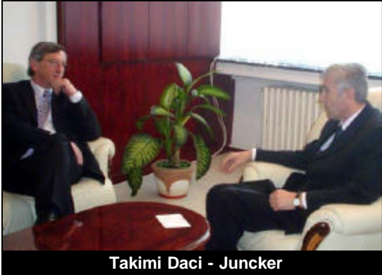
Takimi Daci - Juncker