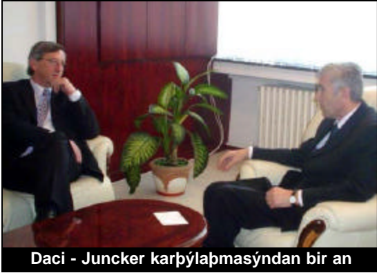
Daci - Juncker karþýlaþmasýndan bir an

DACÝ: Kosova'yý yönetmek için insancýl ve dođal kaynaklara sahibiz JUNCKER: Birleþmiþ Milletler