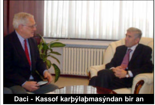
Daci - Kassof karþýlaþmasýndan bir an