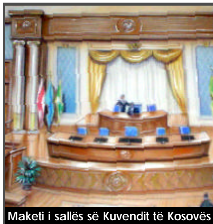
Maketi i sallës së Kuvendit të Kosovës

E nterieri i Kuvendit të Kosovës po merr një pamje të re. Që nga fundi i korrikut të këtij viti punonjësit e firmës “Mabetex Group” kanë filluar punët për meremetimin e sallës, hollit dhe hyrjes së ndërtesës së Kuvendit të Kosovës. Renovimi i enterierit të ndërtesës së Kuvendit të Kosovës, pos tjerash përfshin instalimet elektronike, zërimin, nxemjen, klimatizimin dhe disa punë të tjera. Pritet që pas përfundimit të punëve të krijohen kushte optimale për punë për të gjitha organet e Kuvendit të Kosovës. Pos një pamje më të mirë, gjithsesi deputetët dhe punonjësit e Kuvendit të Kosovës do të kenë në dispozicion një ambient shumë më