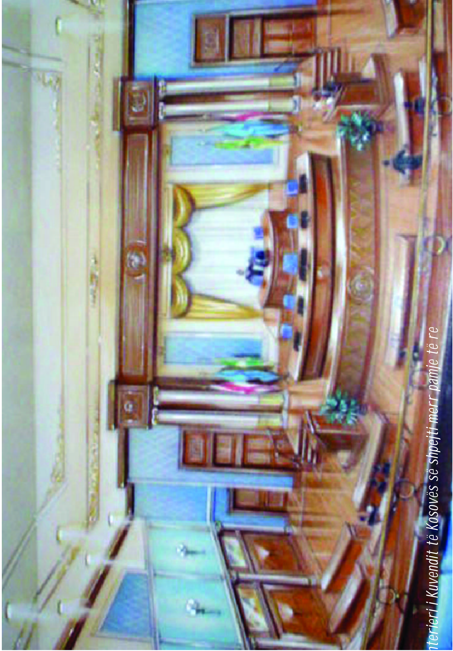
Interior of the Kosovo Assembly