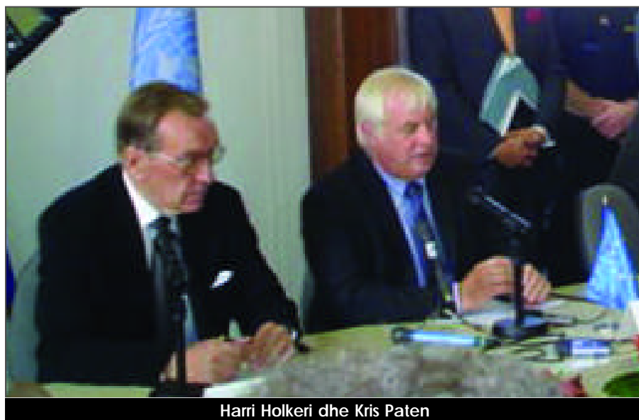
Harri Holkeri dhe Kris Paten

Kur ndodhën sulmet e 11 shtatorit, ajo ditë, ishte paraparë të jetë ditë ndërkombëtare e paqes. Në cilësinë time, si kryetar i Asamblesë së mileniumit, isha dëshmitar i këtyre ngjarjeve të tmerrshme nga selia e Organizatës së Kombeve të Bashkuara në Nju - Jork. Para një muaji, Organizata e Kombeve të Bashkuara ka pësuar edhe një shpërthim në selinë e saj në Bagdad, një vrasje nihiliste, kur një vetëvrasës