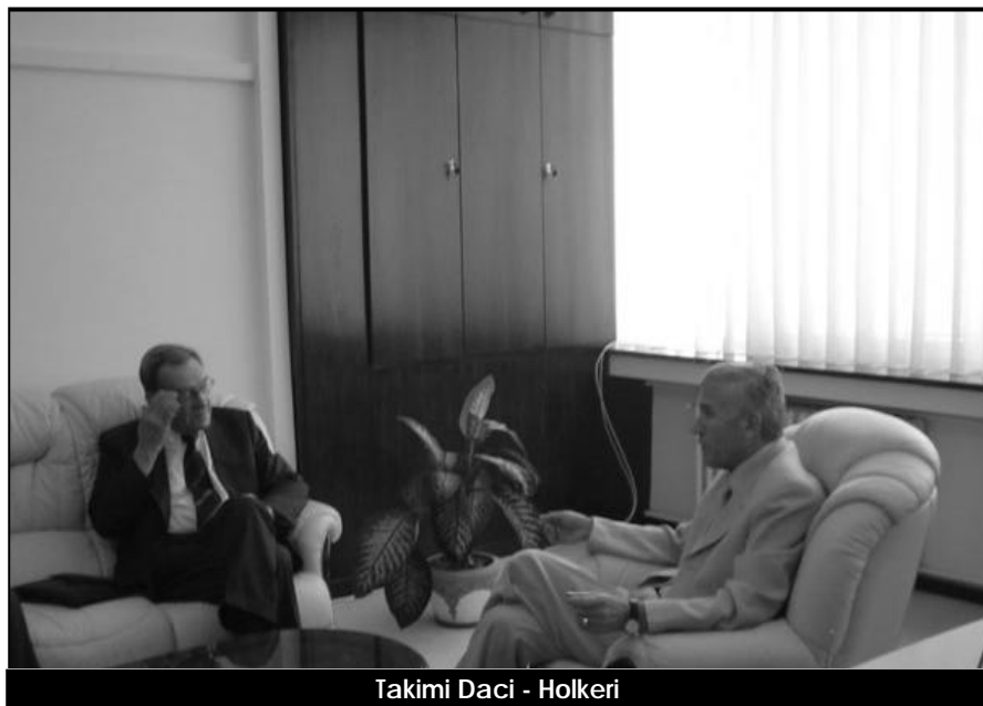
Takimi Daci - Holkeri

Çështja e sigurisë në Kosovë, kthimi i të zhvendosurve, çështja e të zhdukurve, përgatitjet për fillimin e bisedimeve me Beogradin, si dhe zhvillimi ekonomik i Kosovës, ishin tema qendrore të takimit të kryeparlamentarit të Kosovës Nexhat Daci me shefin e ri të UNMIK-ut, Harri Holkerin, që u mbajt në ndërtesën e Kuvendit të Kosovës në Prishtinë. Në këtë vështrim u konstatua se është e nevojshme që në të gjitha këto procese të inkuadrohen më shumë vendasit. Kryeparlamentari Nexhat Daci thekoi me këtë rast se Kosova është e sigurt, madje më shumë se disa vende nga më të zhvilluarat në Evropë, gjithsesi falë punës së UNMIK-ut. Mirëpo, rezultatet do të ishin dukshëm më të mëdha, po të angazhoheshin në këto procese edhe më shumë kosovarët. Na duhet një vision shumë i qartë për të ardhmen e Kosovës, sepse çështjet që thuhet edhe në Rezolutën 1244 po na përsëriten që më shumë së katër vjet. Kosovës i duhet ligji, i cili duhet të mbizotërojë në tërë Kosovën, theksoi profesor Daci. Duke shëstuar çështjen e të zhvendosurve, u theksua se duhet të pasojë një angazhim edhe më i madh për kthimin e tyre, sidomos kur është fjala për ata brenda territorit të Kosovës, duke siguruar lëvizje të lirë e të përhershme të