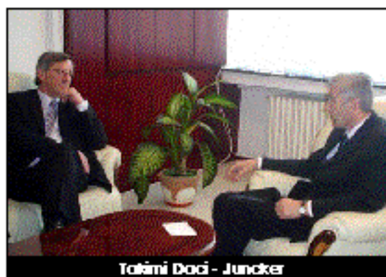
Talimi Daci - Juncker

• JUNCKER: Duhet ecur në rrugën e Rezolutës 1244 të OKB-zë dhe të bashkëpunimit të institucioneve vendëse e ndërkombëtare