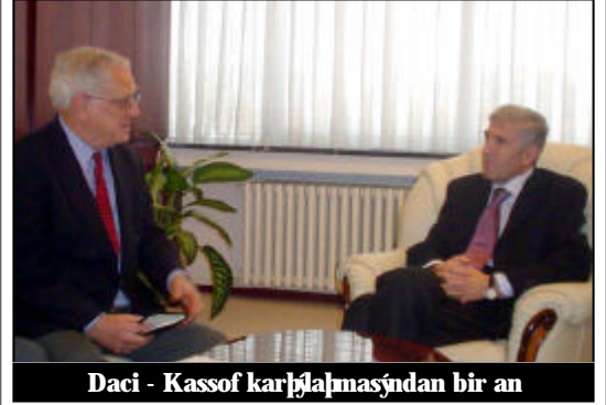
Daci - Kassof görüşmesinden bir an

Kosova başarılı bir övku olarak diğer kriz bölgelerinde de kullanılabilir