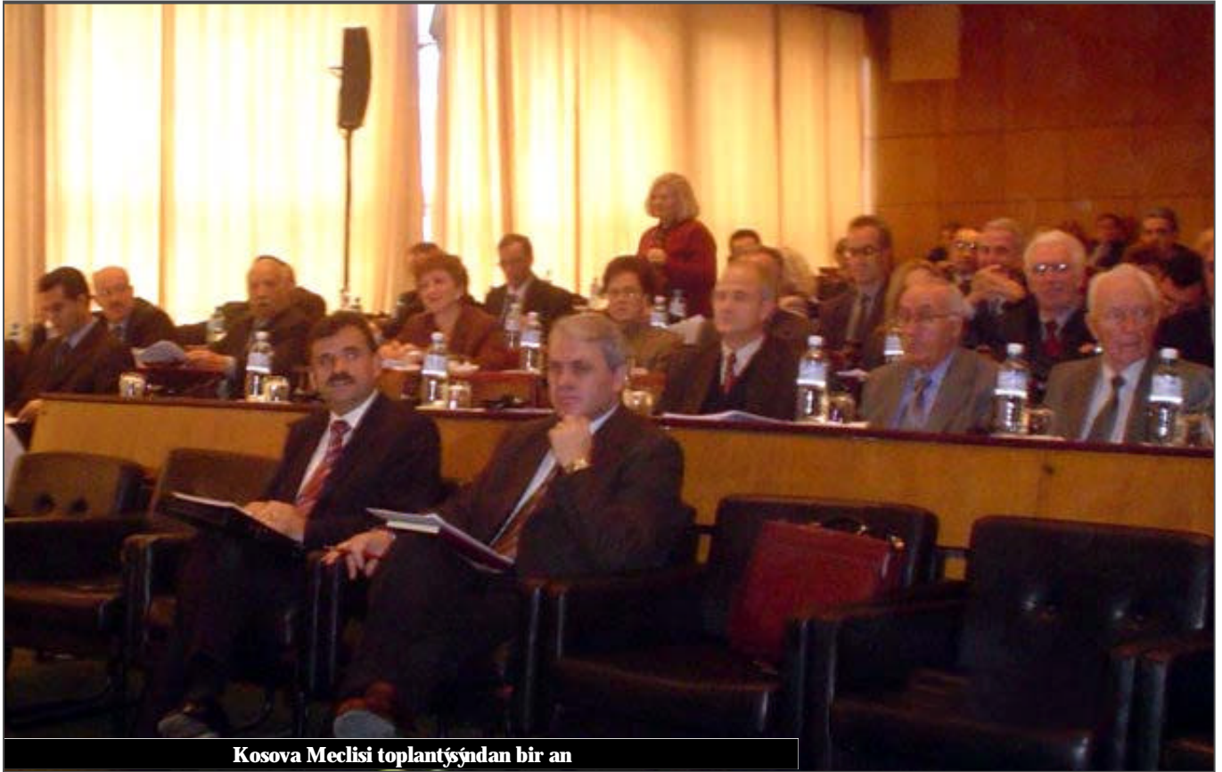
Kosova Meclisi toplantısından bir an

Anayasa Çerçevesi'nin 14. maddesi, bu sürecin bařlatılması için olanak sađlıyor. Aynıca, Kosova Meclisi Yönetmenliđi ile, olası deđişmelerin yöntem ve sürecini çok incelikli bir şekilde belirledik. Sonunda, biz önceden de Anayasa Çerçevesi'nde deđişmeler yaptık, öyleki bu özel bir olay deđil. Biz, Kosova Meclisi Bakanlık Kurulu'nun önerisi üzere, Çalıřma Gurubu'nun kurulması yönünde önerisine de sahibiz. Bu çalıřma grubunda yer alacak ad ve yapıyı konusunda benim uyarım yok, ancak, Kosova Meclisi'nde LDK Partisi Gurubu adına, bu Komisyon'un, 7 üyeden oluşması gerektiđini düşünüyorum. Ve