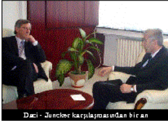
Daci - Juncker karşılaşmasından bir an

JUNCKER: Birleşmiş Milletler Örgütü'nün 1244 Rezolüsyonu ve yerli ile uluslararası