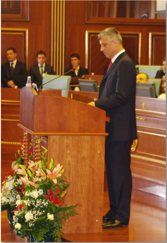
Kryeministri Hashim Thaçi

Në fjalën e tij kryeministri i Kosovës, Hashim Thaçi tha se para pesë vitesh, këtu, në këtë Kuvend, u kurorëzua ëndrra shekullore e qytetarëve tanë, Shpallja e Pavarësisë së Kosovës. "Më 17 shkurt 2008 u themelua shteti i Kosovës me aktin më të lartë historik, juridik dhe politik, me Deklaratën e Pavarësisë, pra Kosova shtet i pavarur dhe sovran. Deputetët e Kuvendit të Kosovës aprovuan Dokumentin më të rëndësishëm historik të Kosovës. Më lejoni të përshëndes deputetët firmëtarë të pavarësisë. Pavarësinë e Kosovës para së gjithash e firmosën dhe e vulosën dëshmorët e lirisë, sakrificave dhe qytetarëve të Republikës së Kosovës. Më 17 shkurt 2008 në gjeografinë politike të Evropës u lind një shtet i ri. Më 17 shkurt 2008 Kosova mori atributin më të lartë të organizimit politik, krijimin e shtetit të pavarur. Më 17 shkurt 2008 Kosova institucionalizoi organizimin më të lartë shoqëror, shtetësinë e saj.