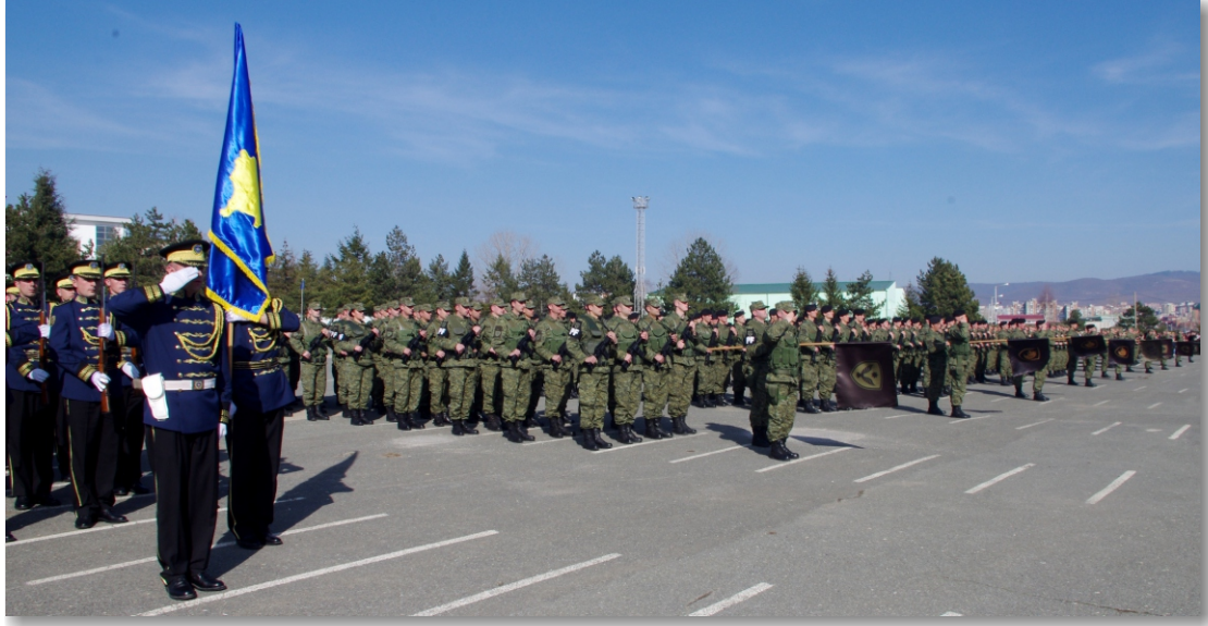
Ceremonia festive në kazermën “Adem Jashari”