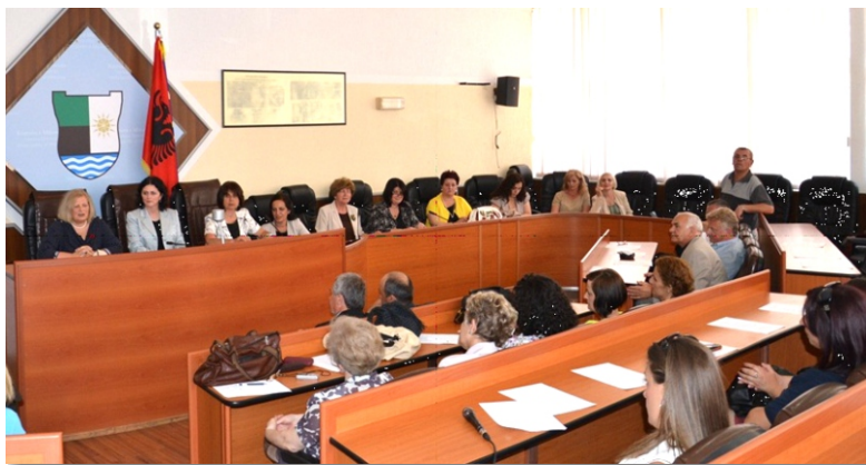
Pamje nga samiti