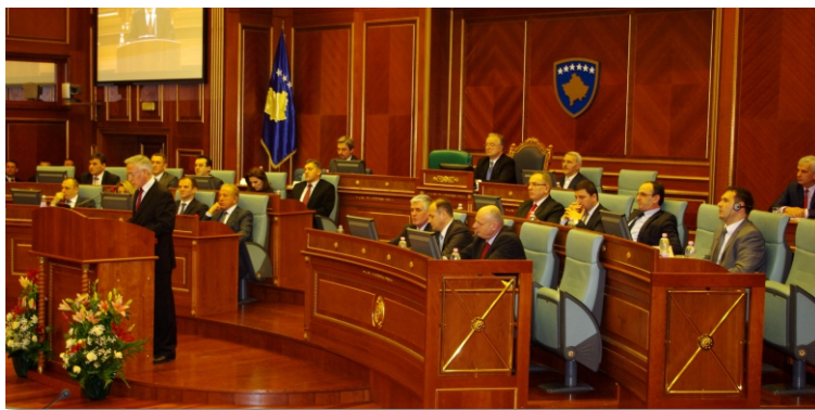
Fjala e kryeparlamentarit Krasniqi

"Ne nuk mund ta ndryshojmë as ta harrojmë historinë, por mund të ndërtojmë bashkë një të ardhme tjetër, paqësore e në miqësi, për gjithë brezat e vendeve tona, duke lënë pas konfliktet dhe luftërat shkatërruese. Kosova gradualisht e ka forcuar subjektivitetin e saj ndërkombëtar, duke u pranuar anëtare e FMN-së, BB-së e BERZH-it dhe duke marrë pjesë në shumë forume rajonale e ndërkombëtare të bashkëpunimit. Por Kosova ende nuk është pjesë e barabartë e projekteve dhe iniciativave të bashkëpunimit e të integritimeve rajonale. Ajo, pa të drejtë mbahet jashtë Këshillit të Evropës, jashtë OSBE-së, jashtë IPU, por edhe jashtë OKB-së e organizmave të tjerë ndërkombëtarë.