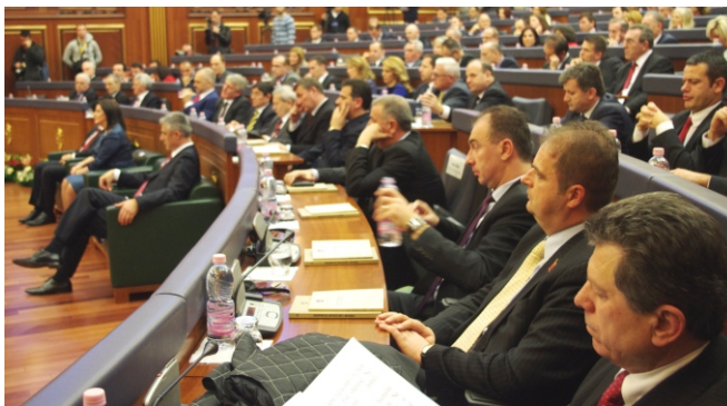
Pamje nga seanca solemne 17 Shkurt 2013

Sot nderojmë çdo shqiptar në Kosovë, çdo familje në Kosovë që kombin e lirinë e kishin sublime, e kishin më të shtrenjtë se jetën e tyre, më të çmuar se pasurinë e tyre, më të madhe se ëndrrat e tyre. Me përulje e mirënjohje, sot kujtojmë e nderojmë Presidentin e parë të Kosovës, Ibrahim Rugovën. Arkitektin e Kosovës së pavarur. Nderojmë besimin e tij të palëkundur tek paqja, përkushtimin, punën, maturinë e vendosmërinë për lirinë, për Kosovën. Sot nderojmë veprën e tij.