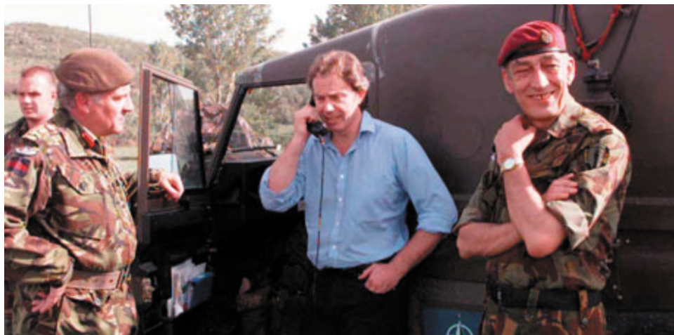
Tony Blair bisedim me telefon me trupat ushtarake Britanike HQ në kufirin e Kosovës afër Shkupit 3 Maj, 1999