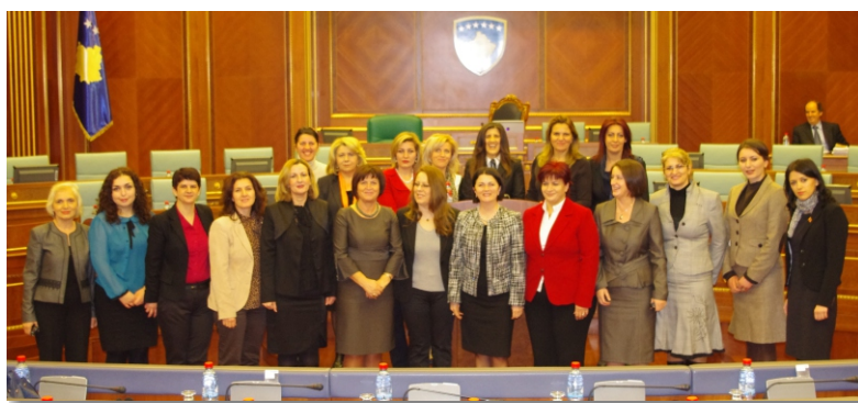
GGD në Kuvend

GGD tashmë ka krijuar fizioniminë e vet duke e pasuruar vazhdimisht me aktivitete të shumta. Zëri i GGD-së ndihet i plotë