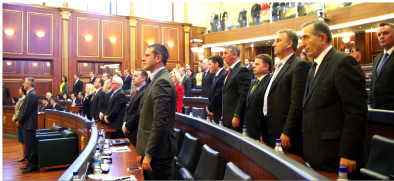
Pamje nga salla

Në kuadër të shënimit të 15-vjetorit të Epopesë së Ushtrisë Çlirimtare të Kosovës, Kuvendi i Republikës së Kosovës, i drejtuar nga dr. Jakup Krasniqi, kryetar, është mbledhur sot në seancë, duke nderuar dhe përkujtuar luftën heroike dhe rënien e Komandantit Legjendar Adem Jashari e të familjes Jashari.