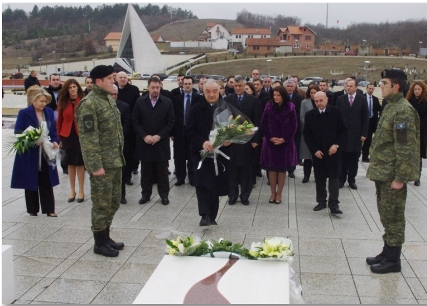
Homazh në memorialin “Adem Jashari” shkurt 2013

Me rastin e shënimit të 5-vjetorit të Shpalljes së Pavarësisë së Kosovës, një delegacion i Kuvendit të Republikës së Kosovës, i kryesuar nga nënkryetari i Kuvendit z. Xhavit Haliti, krahas udhëheqësve më të lartë institucionalë të vendit, Presidentja e Kosovës Atifete Jahjaga, kryeministri Hashim Thaçi, kryetari i LDK, Isa Mustafa, (partia më e madhe në opozitë), si edhe ministra kanë bërë nderime në varreza dhe pranë përmendoreve të dëshmorëve në qendra të ndryshme të Kosovës. Në këto aktivitete ceremoniale, delegacioni i Kuvendit dhe personalitetet më të larta të Kosovës janë shoqëruar nga kryetarët e komunave përkatëse.