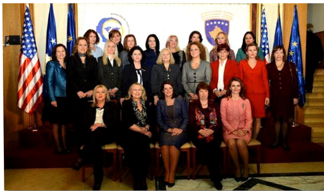
GGD në Kuvend

Grupi i Grave Deputet u formua me 5 korrik 2005 me rastin e vizitës së ish sekretares së SHBA-ve znj Medelin Albright në Kosovë. Atëherë u quajt Grupi Joformal i Grave Deputete të Kuvendit të Kosovës.