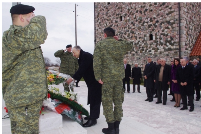
Varrezat e Dëshmorëve Gllagjan