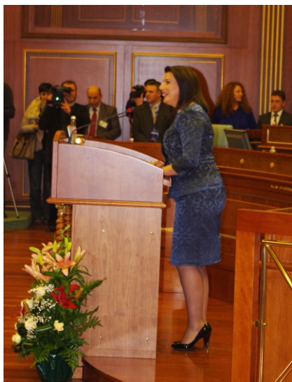
Presidentja Atifete Jahjaga

humane, mbështetjen e pakursyer të miqve tanë të shtrenjtë, në krye me SHBA, BE dhe NATO-n, në çastet më të vështira historike që po kalonte vendi ynë. Gjej këtë rast, që në emër të Kuvendit, qytetarëve që përfaqësojmë dhe timin personalisht, t'u dërgoj përshëndetjet vëllazërore dhe falënderimin e përjetshëm për gjithë mbështetjen dhe miqësinë që na dhanë e po na japin, vende e popuj në katër anët e globit", tha me këtë rast kreu i Kuvendit, dr. Jakup Krasniqi.