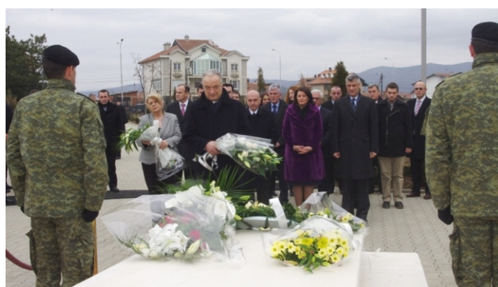
Varri ish presidentit Ibrahim Rugova

5 Vjetori i Pavarësisë vijon me një nga aktivitetet kryesore për Kosovën, parakalimi i trupave ushtarake të FSK-së, organizuar në sheshin kryesor të Prishtinës “Nëna Terezë”