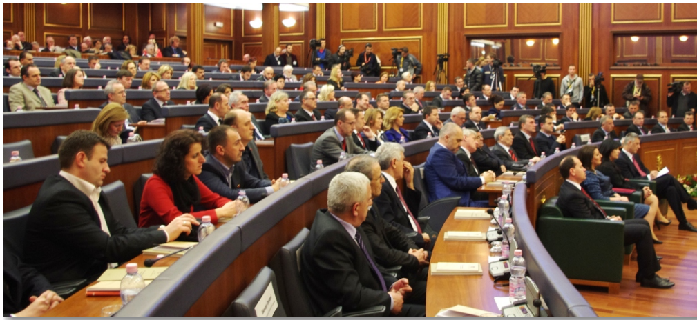
Pamje nga salla 17 Shkurt 2013

Sot është dita e dëshmorëve dhe e lirisë që na sollën me gjakun e tyre, dita e themeluesve e baballarëve të shtetit të Kosovës, në krye me heroin legjendar, komandantin Adem Jashari. Lavdia e tyre, si gjerdan lirie do të stolisë përjetë ballin e Kosovës.