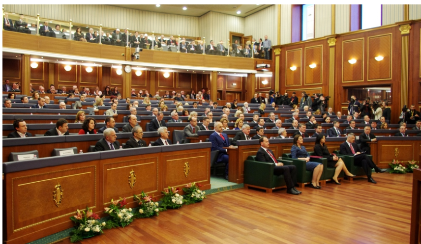
Pamje nga seanca solemne 17 Shkurt 2013

Kosova ka shënuar rritje ekonomike dhe zhvillim të infrastrukturës, duke përmirësuar standardin e jetesës për të gjitha kategoritë shoqërore. Kosova është njohur nga rreth 100 shtete", theksoi kryeministri Thaçi duke shtuar se presim shumë shpejt edhe njohje të reja. Ai theksoi se Kosova është në rrugë për përmbushjen e kritereve për t'u anëtarësuar në institucionet euroatlantike në BE, NATO, dhe në rrugën drejt anëtarësimit në Organizatën e Kombeve të Bashkuara. "Natyrisht, në tërë këtë proces, Kosova do të ballafaqohet me sfida, por jam i bindur se politika kosovare, bashkërisht dhe në koordinim të ngushtë me miqtë ndërkombëtar do t'ia arrijmë të realizojmë këto synime.", tha kryeministri i vendit, Hashim Thaçi