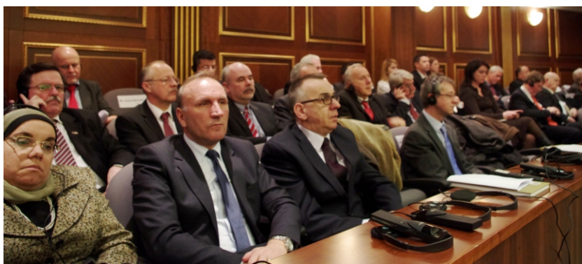
Trupa diplomatike dhe miq të tjerë të ftuar

Duke përmendur dialogun me Serbinë, ai tha se duke qenë ndërmjetësues në këtë dialog Bashkimi Evropian, shpresojmë që do të ushtrohet ndikim pozitiv mbi autoritetet serbe, për të hequr dorë nga strukturat kriminale të instaluara në veri të Kosovës, për t'i hapur rrugë veprimit efikas të institucioneve tona e të EULEX dhe për të bërë të mundur zgjedhjen e përfaqësuesve nga vetë qytetarët atje.