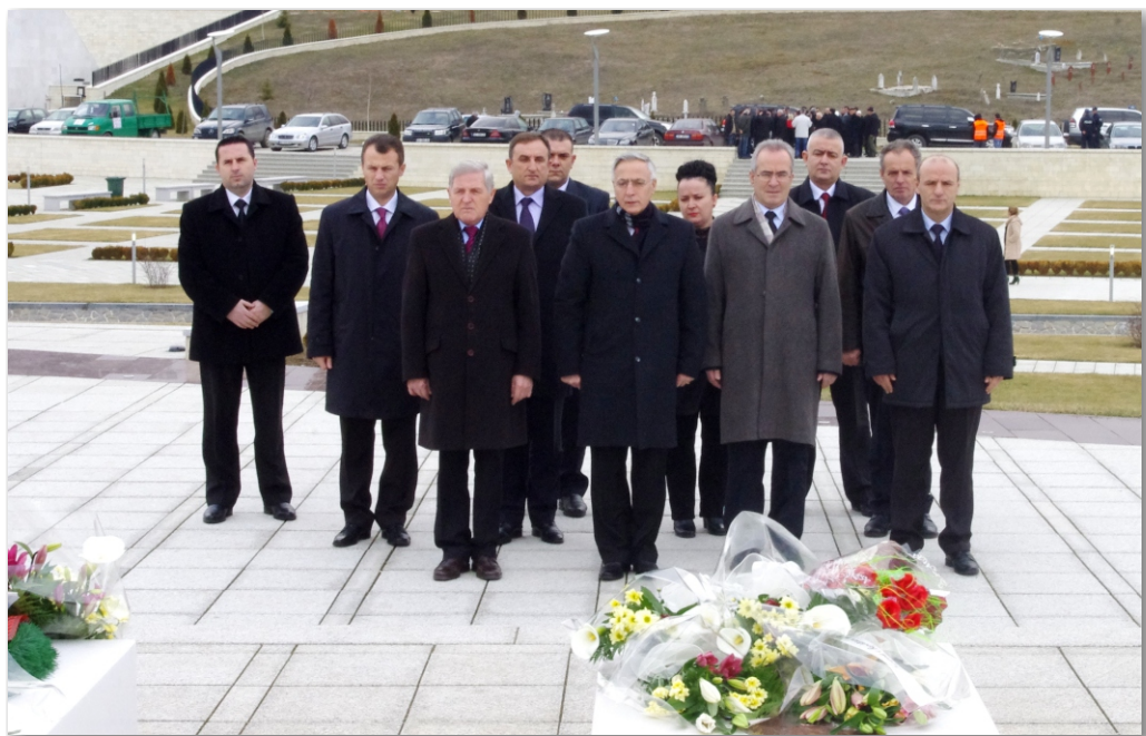
Homazh në memorialin “Adem Jashari” 17.02.2013

Kryetari i Kuvendit të Kosovës z. Jakup Krasniqi bëri homazhe nderimi në Kompleksin Memorial “Adem Jashari” dhe si zakonisht një vizitë në familjen e Jasharajve e më tej me pritjet dhe aktivitetet e tjera. Ndërsa një delegacion i Kuvendit, i kryesuar nga nënkryetari i Kuvendit z. Xhavit Haliti bëri nderime në varreza dhe përmendore të dëshmorëve të Kosovës