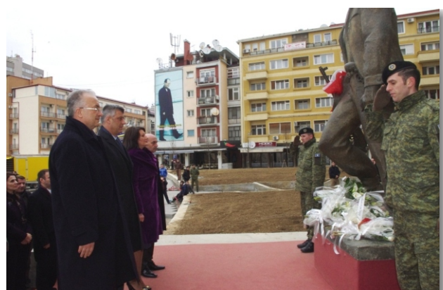
Shtatorja Zahir Pajaziti

Në Prishtinë, delegacioni parlamentar ka bërë nderime dhe ka vendosur kurora lulesh pranë shtatores së dëshmorit Zahir Pajaziti dhe varrit të ish-presidentit Ibrahim Rugova.