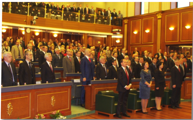
Pamje nga seanca solemne

Me këtë rast ai tha se pas përpjekjeve e luftërave gati njëshekullore për liri dhe duke mbyllur kapitullin historik të robërisë e të gjenocidit, Kosova më 17 shkurt 2008, me koordinim ndërkombëtar, u shpall shtet i pavarur, sovran dhe demokratik. "Plaga e rëndë ballkanike, e quajtur çështje e Kosovës, pushoi së rrjedhuri gjak. Padrejtësia e madhe historike e vitit 1913, ndonëse me vonesë, u ndreq. Pesë vjet s'mund të bëjnë veç një jubile i vogël, por i një ngjarjeje të madhe dhe historike që po shënojmë sot. Drejtësia e luftës dhe e përpjekjeve tona të gjata, idealet e larta që i udhëhoqën ato, i dhanë shumë shpejt legjitimitet ndërkombëtar Pavarësisë së Kosovës, si shtet i ri, i lirë, sovran dhe demokratik, "tha kreu i Kuvendit, duke shtuar se pavarësia e Kosovës përbën një fakt tashmë të pamohueshëm dhe të pakthyeshëm historik, politik e diplomatik.