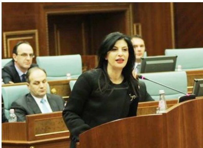
Kryeparlamentarja e Shqipërisë Jozefina Topalli

Kryetarja e Kuvendit të Republikës së Shqipërisë, Jozefina Topalli, duke uruar festën e Pavarësisë së Kosovës, tha se ndjehet shumë e lumtur që është në Kosovë dhe ka mundësinë që të flas përpara parlamentit të Kosovës së lirë, të pavarur e demokratike.