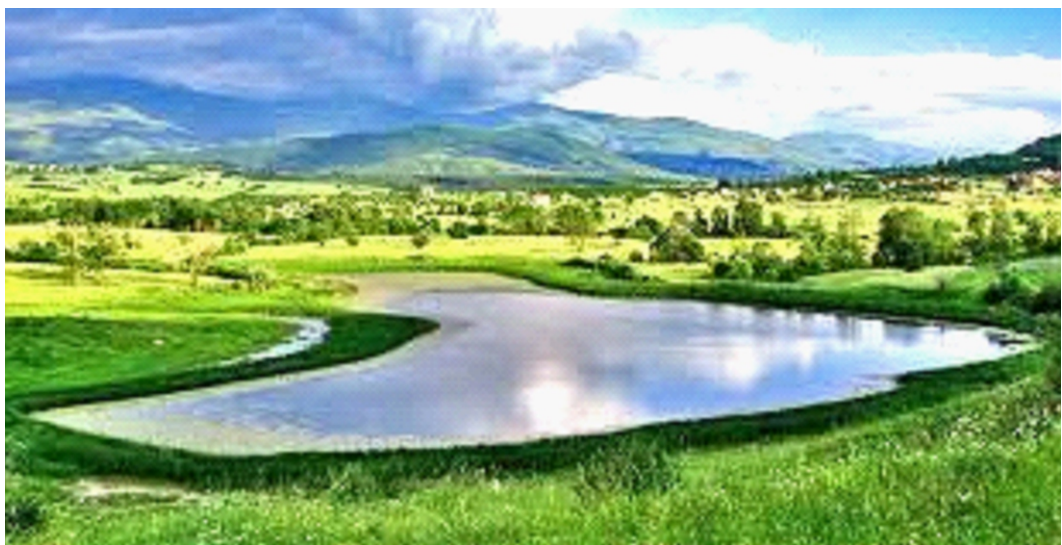
Mali i Sharrit